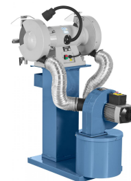
Abbildungen mit Schleifmaschine, nicht im Lieferumfang enthalten