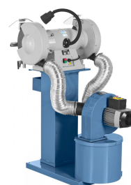
Abbildungen mit Schleifmaschine, nicht im Lieferumfang enthalten