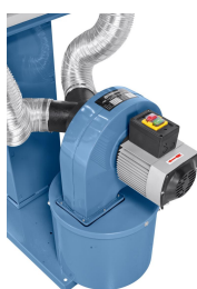
Ein-Aus-Schalter nach IP54 mit Unterspannungsauslöser. Leistungsstarker Antriebsmotor, besonders laufruhig.