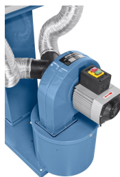
Ein-Aus-Schalter nach IP54 mit Unterspannungsauslöser. Leistungsstarker Antriebsmotor, besonders laufruhig.