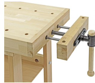
Zinkenverleimte Hinterzange mit stabiler Parallelstabführung