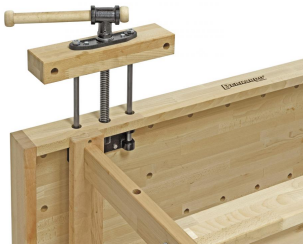
Französische Vorderzange mit Trapezgewindespindel und Parallelstabführung