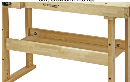
Inklusive Ablageboden für zusätzlichen Stauraum