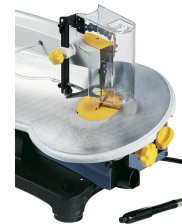
Schwenkbarer Arbeitstisch von -10^\circ bis +45^\circ