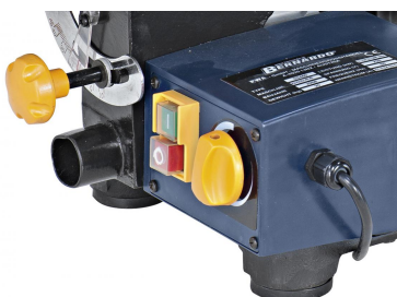
Stufenlose einstellbare Hubzahl