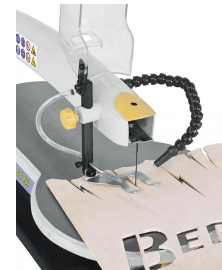
Anwendungsbeispiele: Außenschnitt / Innenschnitt