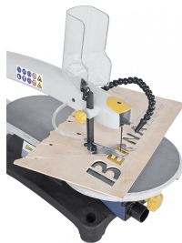
Anwendungsbeispiele: Außenschnitt / Innenschnitt