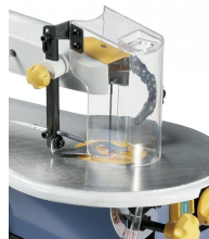
Höhenverstellbarer und transparenter Sägeblattschutz für freie Sicht auf das Werkstück