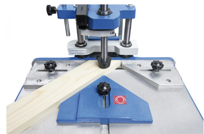
Verstellbare Anschläge serienmäßig zur optimalen Positionierung und Fixierung des Werkstückes