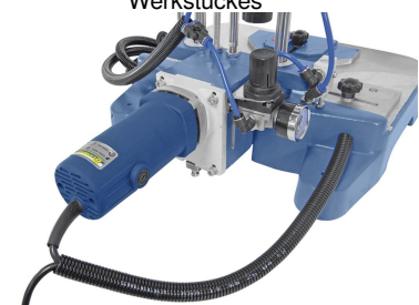
Starker Antriebsmotor zum Fräsen von Keilnuten mit Schwalbengröße W-1, W-2 und W-3