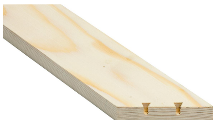
Individuell auf die gewünschte Schwalbenlänge einstellbare Frästiefe