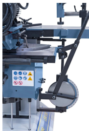
Serienmäßig mit Schablonenvorrichtung zum Bohren von schrägen Schlitten