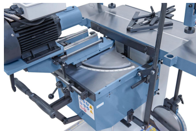
Bohraggregat rechts und links 60° schwenkbar