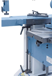
Führung für Höhenverstellung spielfrei einstellbar