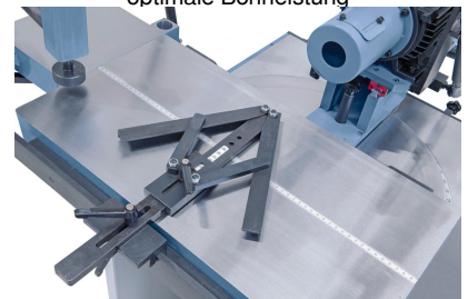
Inklusive stufenlos einstellbarem Doppel-Gehrungsanschlag von 30° bis 90°