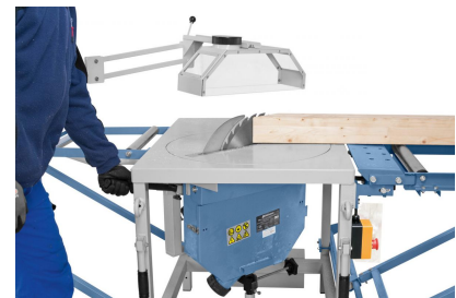
Gehrungskappschnitt 90° + 45°