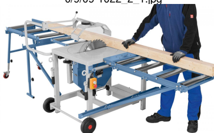
Sägen mit Schiebetisch