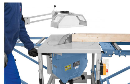
Gehrungskappschnitt 90° + 45°