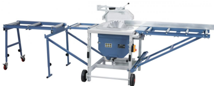
Abbildung mit optionaler Zufuhr- und Abfuhrrollenbahn.