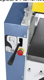
Vorschub ist zum Abrichthobeln ausschaltbar.