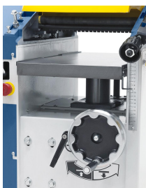
Dickentisch aus Grauguss mit mittiger