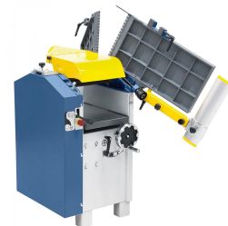
Schnelles und einfaches Umrüsten vom Abrichten zum Dickenhobeln durch aufklappbare Abrichttische.