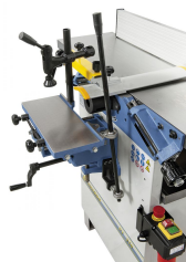
Die optional erhältliche