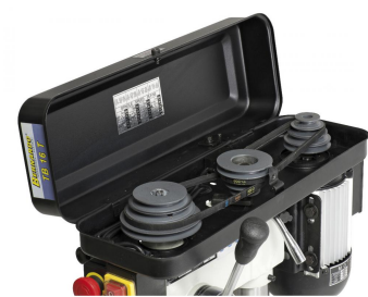
Gewuchtete Grauguss-Antriebsscheiben für hohe Laufruhe, die hochwertigen Keilriemen sorgen für eine optimale Kraftübertragung