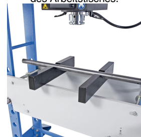
Zum Ausrichten von Wellen sind optional Prismenauflagen erhältlich.