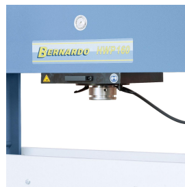
Hartverchromter Kolben aus vergütetem Spezialstahl.