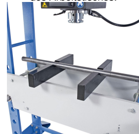
Zum Ausrichten von Wellen sind optional Prismenauflagen erhältlich.