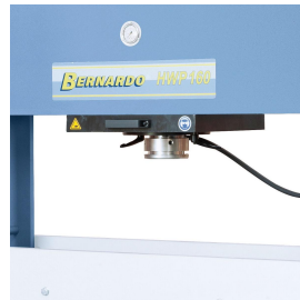
Hartverchromter Kolben aus vergütetem Spezialstahl.