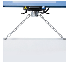
Inklusive Vorrichtung zur Höhenverstellung des Arbeitstisches.