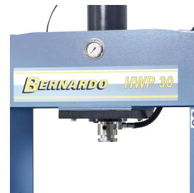
Hartverchromter Kolben aus vergütetem Spezialstahl.