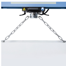
Inklusive Vorrichtung zur Höhenverstellung des Arbeitstisches.