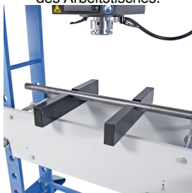
Zum Ausrichten von Wellen sind optional Prismenauflagen erhältlich.