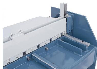
Die robuste Rechteckführung garantiert eine optimale Führung des Obermessers.