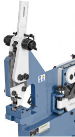
Serienmäßig mit Lochstanzeinheit für Löcher bis 20 mm