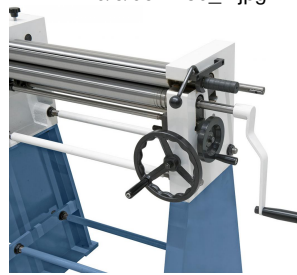
Die Zustellung der Unter- und Hinterwalze erfolgt über ergonomisch angebrachte Handräder.