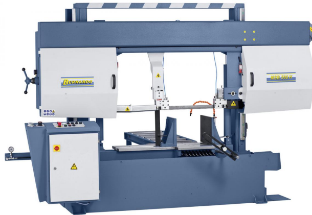
Abbildung von MSB 560 H

Die Serie dieser halbautomatischen Bandsägen deckt einen großen Schnittbereich ab, dadurch steht für eine Vielzahl von Anwendungsgebieten die richtige Maschine zur Verfügung. Die halbautomatische Funktionsweise ermöglicht ein schnelles und einfaches Bearbeiten der Werkstücke.