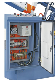
Übersichtlich aufgebauter Schaltkasten mit hochwertigen Elektrokomponenten.