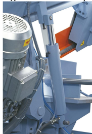
Stabiler Hydraulikzylinder zum feinfühligem