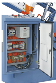
Übersichtlich aufgebauter Schaltkasten mit hochwertigen Elektrokomponenten.