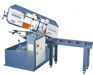
Serienmäßig mit Rollenbahn zum Auflegen