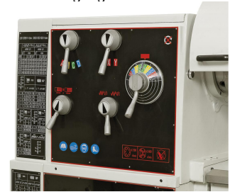
Einfache Bedienung, alle Schalt- und Bedienelemente übersichtlich am Getriebekopf angebracht.