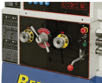
Vorschubgetriebe leicht und präzise schaltbar, geschliffene Zahnräder sorgen für einen ruhigen Lauf.