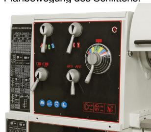
Einfache Bedienung, alle Schalt- und Bedienelemente übersichtlich am Getriebekopf angebracht.