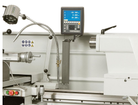
Die serienmäßige 3-Achs-Positionsanzeige garantiert einfacheres Arbeiten und höhere Genauigkeit.