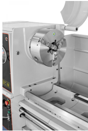
Vorteil des Bernardo-Stahlfutters: PO3-315 mm / D8: Monoblock,- Grund,- Umkehr- und Aufsatzbacken lieferbar.