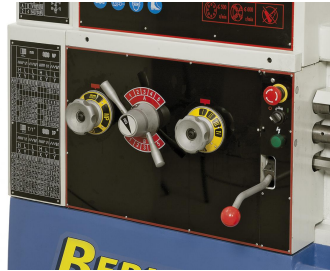
Vorschubgetriebe leicht und präzise schaltbar, geschliffene Zahnräder sorgen für einen ruhigen Lauf.