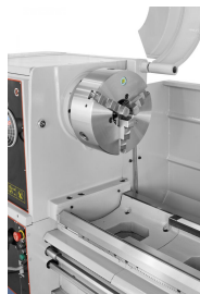
Vorteil des Bernardo-Stahlfutters: PO3-315 mm / D8: Monoblock,- Grund,- Umkehr- und Aufsatzbacken lieferbar.