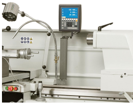
Die serienmäßige 3-Achs-Positionsanzeige garantiert einfacheres Arbeiten und höhere Genauigkeit.