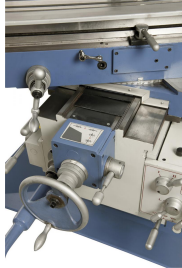
Großdimensionierte Flachführungen garantieren Stabilität bei hoher Fräsbelastung, Frästisch schwenkbar von -45^\circ bis +45^\circ .