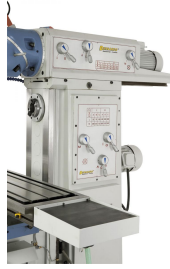
Logisch und übersichtlich aufgebaute Getriebebeschaltung für die Drehzahleinstellung