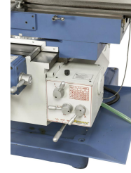
Durch den serienmäßigen Tischvorschub mit Eilgangfunktion in allen 3 Achsen werden die Nebenzeiten erheblich reduziert.