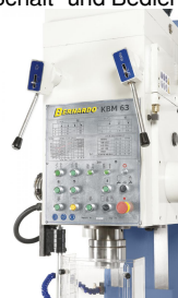
Übersichtlich aufgebauter Bohrkopf mit sämtlichen Schalt- und Bedienelementen.