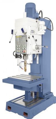
Abbildung KBM 63

Die Kastenständerbohrmaschine KBM 80 ist für Bohr, Reib- und Gewindeschneidarbeiten sowohl in der Einzel-als auch in der Serienfertigung geeignet. Durch die massive Graugusskonstruktion kann dieses Modell für schwere Zerspanungsarbeiten in Maschinenbau, Produktion und Anlagenbau eingesetzt werden.