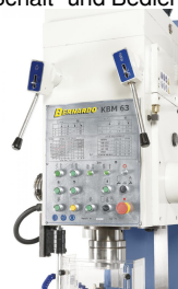
Übersichtlich aufgebauter Bohrkopf mit sämtlichen Schalt- und Bedienelementen.