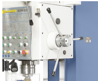
Sterngriff für manuelle Pinolenzustellung, Kupplungshebel für automatischen Vorschub. Übersichtlich aufgebauter Bohrkopf mit sämtlichen Schalt- und Bedienelementen.