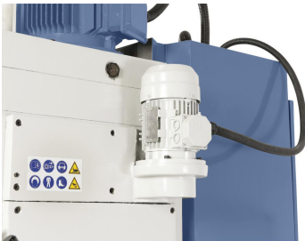
Vorschubmotor zur Reduzierung der Positionierzeiten der Pinole