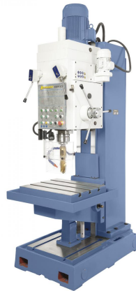
Abbildung KBM 63

Die Kastenständerbohrmaschine KBM 80 ist für Bohr, Reib- und Gewindeschneidarbeiten sowohl in der Einzel-als auch in der Serienfertigung geeignet. Durch die massive Graugusskonstruktion kann dieses Modell für schwere Zerspanungsarbeiten in Maschinenbau, Produktion und Anlagenbau eingesetzt werden.