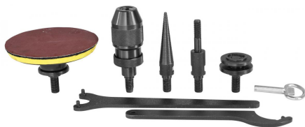
Umfangreiches Standardzubehör für vielfältige Einsatzmöglichkeiten