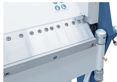
Gehärtete und geschliffene Segmente sorgen für ein exaktes Biegen.