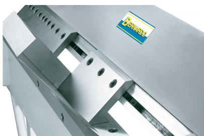
Durch die einzeln herausnehmbaren Segmente können auch Schachteln, Boxen usw. gebogen werden.