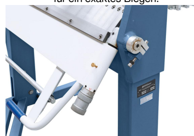
Die Einstellung der gewünschten Materialstärke erfolgt schnell und einfach mittels Einstellschraube