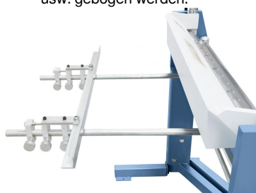
Serienmäßig mit Hinteranschlag ausgestattet.