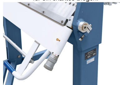
Die Einstellung der gewünschten Materialstärke erfolgt schnell und einfach mittels Einstellschraube