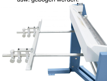
Serienmäßig mit Hinteranschlag ausgestattet.