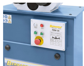
Übersichtlich angeordnete Bedienelemente an der Vorderseite.