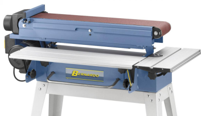
Horizontal und vertikal verwendbares Schleifaggregat.