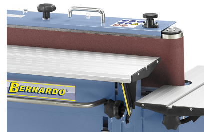
Höhenverstellbarer Arbeitstisch (bis 110 mm) zur optimalen Ausnutzung der Schleifbandbreite.