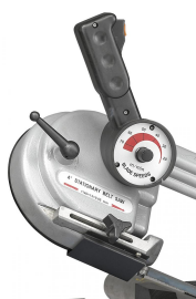
Stufenlos einstellbare Bandgeschwindigkeit für optimale Schnittergebnisse