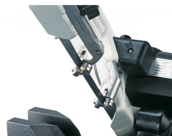
Kugelgelagerte Sägebandführung mit Schnellverstellung zum Anpassen an die Werkstückbreite garantiert ein optimales Arbeitsergebnis.