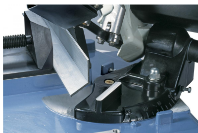
Verstellbarer Sägebügel zum Gehrungsschneiden.