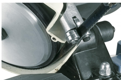
Das hochwertige Alu-Antriebsrad mit Gummibandage sorgt für einen ruhigen Lauf.