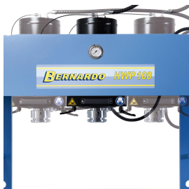
Seitlich verschiebbarer Kolben für universellen Einsatz.