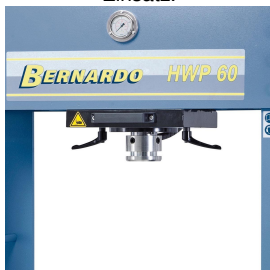
Hartverchromter Kolben aus vergütetem Spezialstahl.