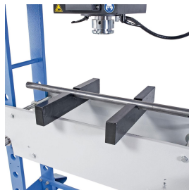
Zum Ausrichten von Wellen sind optional Prismenauflagen erhältlich.