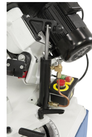
Für feinfühliges Absenken des Sägebügels serienmäßig mit Hydraulikzylinder ausgerüstet.