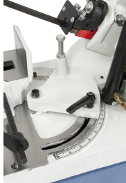
Schwenkbarer Sägebügel zum Doppelgehrungsschneiden von -45° bis +60°.