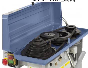
Hohe Laufruhe durch gewuchtete Antriebsscheiben.