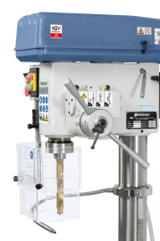
Serienmäßig mit automatischen Pinolenvorschub.