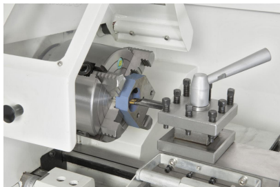
Planschibe 125 mm (Option) ideal zum Aufspannen von asymmetrischen Werkstücken