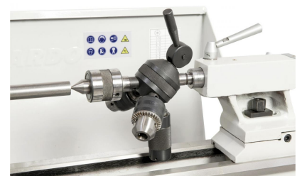
Zum wirtschaftlichen Arbeiten kann die Maschine mit einem Revolverkopf ausgestattet werden