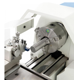
3-Backenfutter 125 mm mit Dreh- und