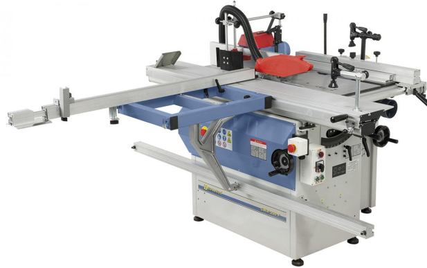
Abbildung von CWM 260 F - 1200

Die Universal-Kombinationsmaschine CWM 260 F ist unser Einsteigermodell bei den Holz-Bearbeitungszentren mit Formattisch. Diese Maschine bietet eine Vielzahl an Anwendungsmöglichkeiten auf kleinstem Raum - Abrichthobeln, Dickenhobeln, Sägen, Fräsen, Bohren. Kurze Umrüstzeiten, hoher Bedienkomfort zeichnen dieses Modell aus.