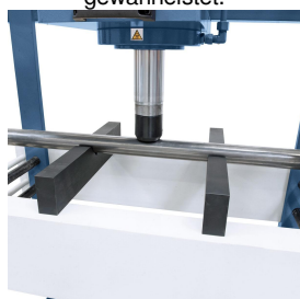
Die Prismenauflagen ermöglichen das Ausrichten von Wellen, Achsen, usw.