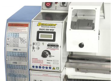
Elektronisch, stufenlose Drehzahlregelung, leichtes Ablesen mittels Digitalanzeige.