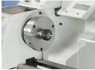
Das Spannzangenfutter ER 25 gewährleistet eine hohe Rundlaufgenauigkeit beim Spannen von Werkstücken, Spannbereich 1 - 16 mm.