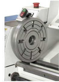
Zum Aufspannen von speziell geformten Werkstücken kann die Maschine mit einer 240 mm Aufspannscheibe ausgerüstet werden.