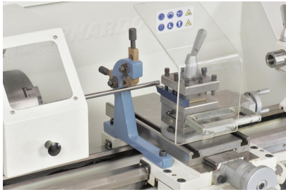
Die mitlaufende Lünette verhindert das Durchbiegen von dünnen Wellen.