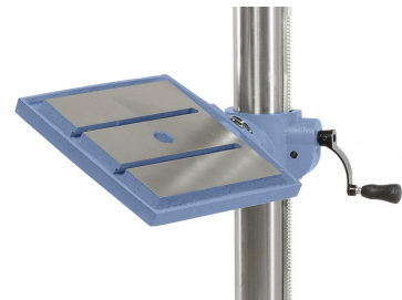
Der Bohrtisch ist von -45^\circ bis +45^\circ schwenkbar und 360^\circ um die Säule drehbar.