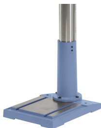
Bearbeitete Bodenplatte mit Nuten

Leichtgängige Pinolenstellung über ergonomisch angeordnete Handgriffe.