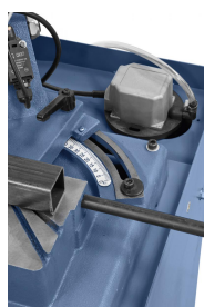
Schwenkbarer Sägebügel für Gehrungsschnitte bis 60°