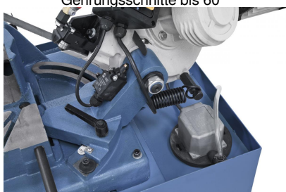
Kühlmittleinrichtung im Lieferumfang enthalten