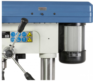
Leistungsstarker Aluminium-Motor nach IP 54