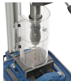
Präzises Arbeiten durch die serienmäßige Kreuzlinien-Lasereinrichtung