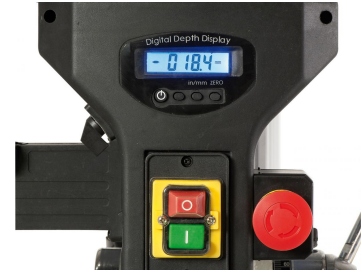
Digitale Bohrtiefeanzeige für komfortables Arbeiten