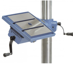
Der Bohrtisch ist 360° schwenkbar und um die Säule drehbar