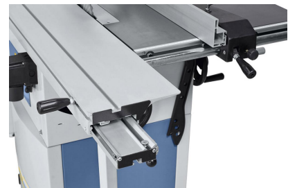
Gehärtete Prismenführung für einen leichtgängigen Lauf des Formattisches.