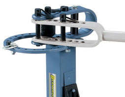
Viele Einstellmöglichkeiten zum Biegen von einfachen und komplexen Werkstücken