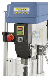
Not-Halt-Taster, Drehrichtungsschalter und 2-Stufenschalter an der Vorderseite der Maschine.