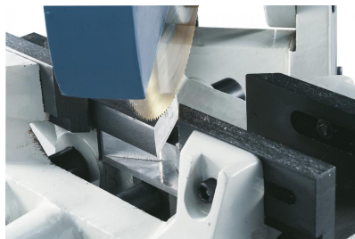
Schwenkbarer Getriebekopf (45° links / rechts), optimal für Gehrungsschnitte.