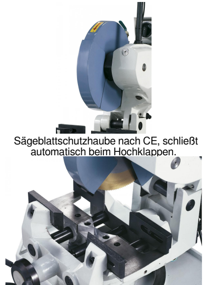
Sägeblattschutzhaube nach CE, schließt automatisch beim Hochklappen.