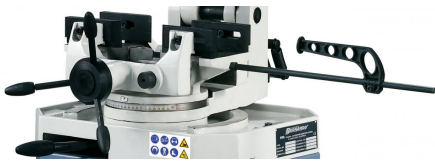
Doppelschraubstock mit Materialanschlag, für Gehrungsschnitte nach links und rechts schwenkbar.