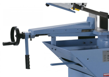
Der massive Schraubstock aus Grauguss ist mit einer Schnellarretierung ausgestattet -