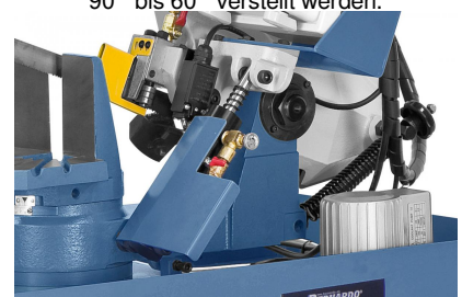
Für feinfühliges Absenken des Sägebügels serienmäßig mit Hydraulikzylinder ausgestattet.