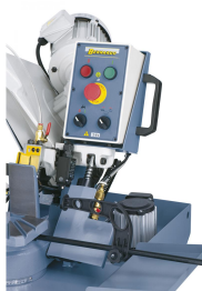
Schaltelemente übersichtlich im Elektropaneel angebracht.