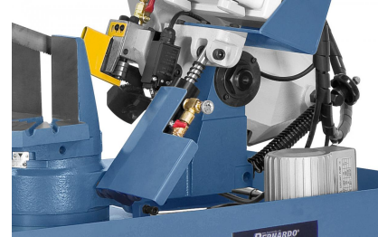
Für feinfühliges Absenken des Sägebügels