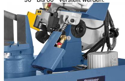
Für feinfühliges Absenken des Sägebügels