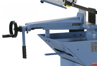
Der massive Schraubstock aus Grauguss ist