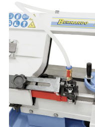
Kugelgelagerte Sägebandführung mit Schnellverstellung zum Anpassen an die Werkstückbreite garantiert ein optimales Arbeitsergebnis