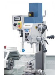
Fräsaufsatz FA 16 optional lieferbar. Technische Daten siehe Proficenter 550 WQV