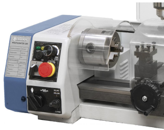
Schaltelemente (Drehzahlregelung, Wahlschalter, Vorschub, ...) am Spindelstock angebracht