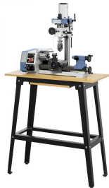
Proficenter 250 mit optionale Untergestell und Schnellspannbohrfutter