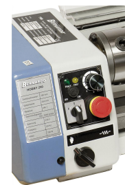
Einfache Bedienung, alle Schaltelemente zentral am Spindelkopf