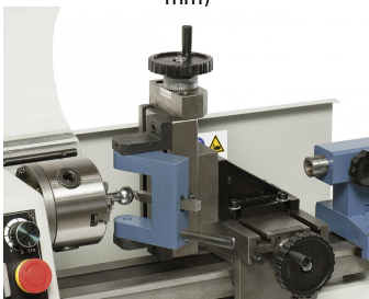
Vertikal-Frässupport mit montierter Kugeldrehereinrichtung (Option)