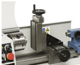
Optional lieferbar: Vertikalfrässupport mit einer Aufspannfläche von 64 x 130 mm