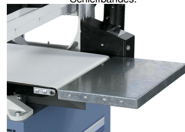
Vergrößerte Auflagefläche durch beidseitige Tischverlängerungen.