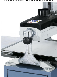
Klemmsystem zum Fixieren der Schleifeinheit.