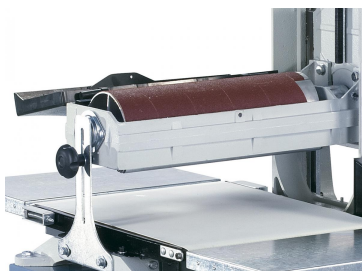
Aufklappbare Absaughaube zum Wechseln des Schleifbandes.