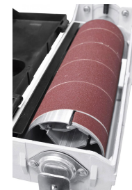
Schnellspannsystem zum Befestigen des Schleifbandes.