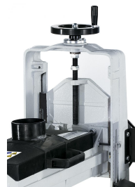
Stabiles Führungssystem, Höhenverstellung mittels Handrad.