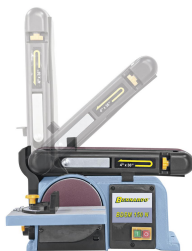
Planschleiftisch stufenlos schwenkbar von 0° bis 90°.