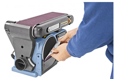
Inklusive Klettverschluss zur Befestigung des Schleiftellers.