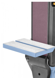
Tellerschleiftisch kann zum Bandschleifen verwendet werden.