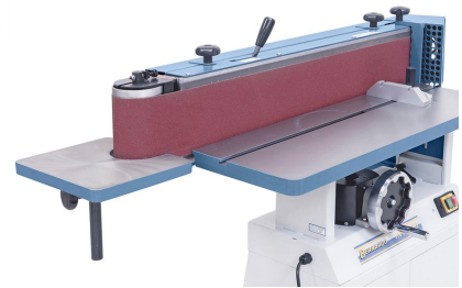
Der höhenverstellbare Zusatztisch ermöglicht das Schleifen von Konturen an der Umlenkrolle