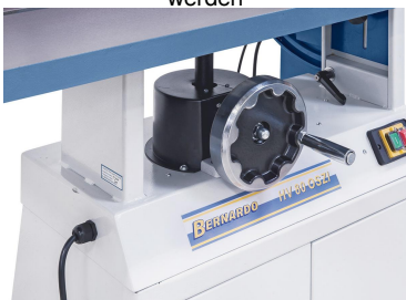
Die Höhenverstellung des Arbeitstisches erfolgt über ein ergonomisch angebrachtes Handrad an der Vorderseite der Maschine