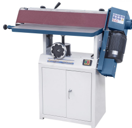
Schleifaggregat kann in jeder beliebigen Position von 0^\circ - 90^\circ stufenlos geklemmt werden