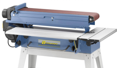
Horizontal und vertikale verwendbares Sägeaggregat