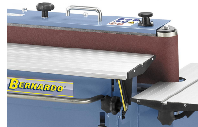
Höhenverstellbarer Arbeitstisch zur optimalen Ausnutzung der Schleifbandbreite